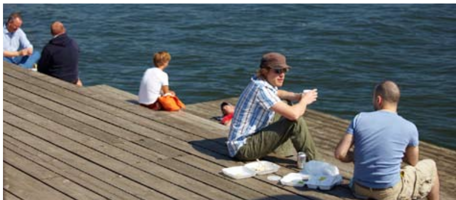
Vattenkontakten ger ett rikt folkliv under sommarhalvåret.

Detta med blicken utifrån på området har varit en genomgående fråga i denna studie: vad tänker man om de delvis nedsättande resonemang som finns kring området – ”pensionärskuvös”, ”gräddhylla” och så vidare. Fick de som flyttat