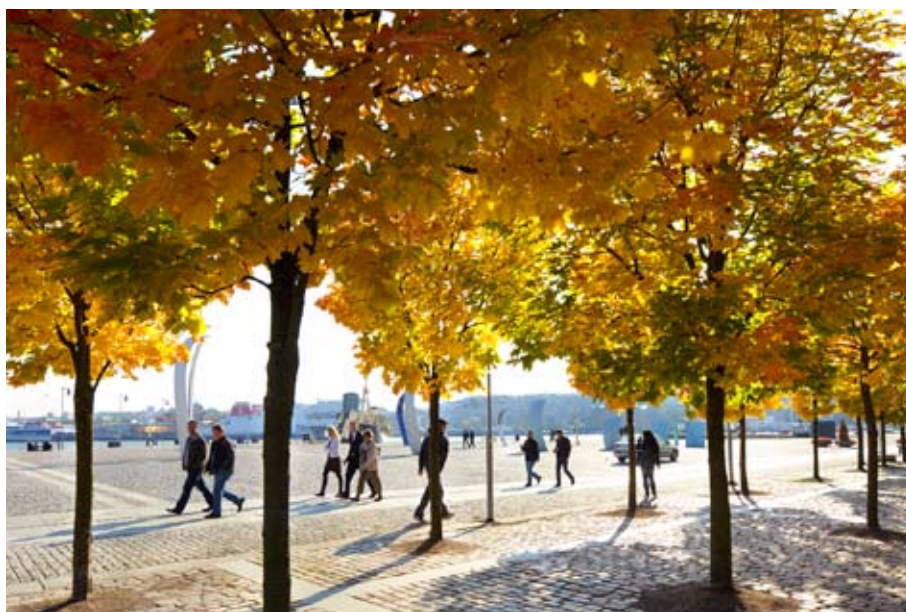
Höstprakt vid Lindholmen

Intressant nog angående framtidsankarna för området är att de flesta trots allt är nöjda med det mesta. Sin boendesituation, både vad lägenhet och läge beträffar: det är som vi sett få som funderar på en flytt och om det skulle bli aktuellt så är det rimligt att tro att de flesta skulle vilja byta inom stadsdelen man bor. Detta sannolikt för att det mesta både finns här och fungerar tillfredställande i stort: kollektivtrafiken gör det enkelt att förflytta sig dit man behöver, de vardagliga inköpen kan oftast göras i närheten av bostaden och på vägen hem från arbete eller hämtning i skola eller förskola. Det finns tillgång till vardaglig motion, både utomhus och genom olika gym. Läsningen av det som informanterna sagt under intervjuerna pekar framförallt ut avsaknaden någon slags kulturinstitution som det som inte alls finns, det skulle exempelvis kunna vara ett för området som helhet mer centralt beläget bibliotek.