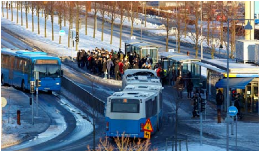
Stombuss 16 vid hållplats Lindholmen.

Bland de som intervjuats inom ramen för den här studien kan man, kring temat ”rörelseaktioner” säga att det som man inte tycker finns på Norra Älvstranden, det rör man sig inte till angränsande stadsdelar som Bräcke, Wieselgrensplatsen, Backaplan eller Kville efter. När ett bristande utbud uttrycks är referenspunkten för var det man eftersöker eller redan har snarare Göteborgs innerstad eller för den delen andra städer. I hänseendet spektakulär utsikt och närhet till vattnet så liknar exempelvis Eriksberg New York eller någon annan metropol. Går man och längtar efter att vara ”någon annan” här? På vilket sätt identifierar man sig som Norra Älvstrandsbo egentligen?