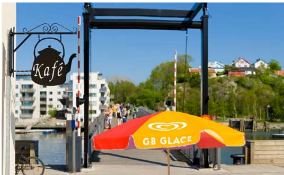
Serviceutbudet på Norra Älvstranden har blivit större varefter stadsdelarna byggts ut.