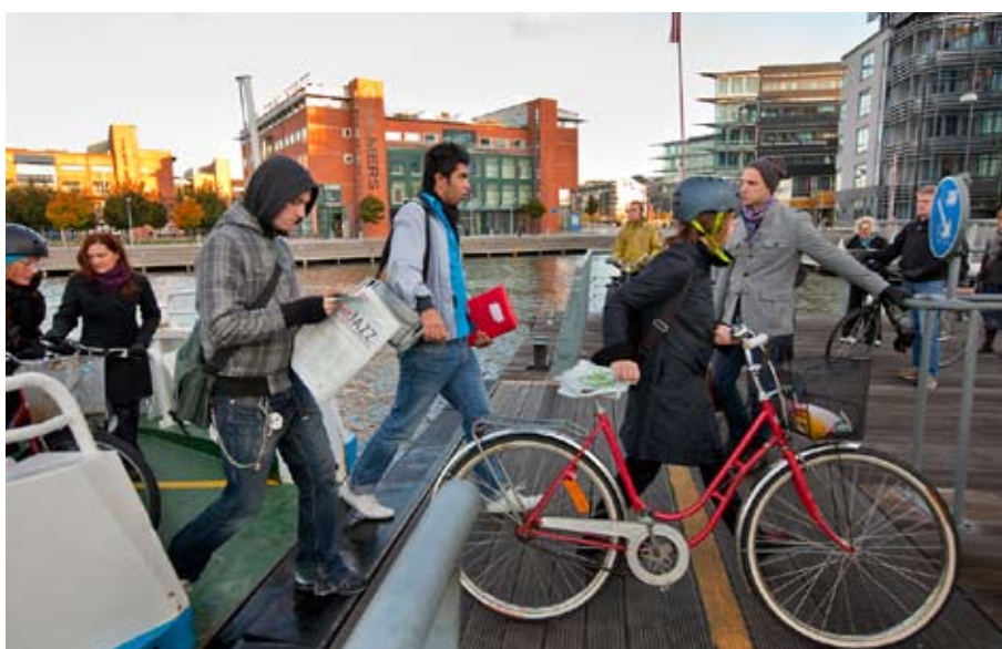
Älvsnavben släpper av passagerare vid Lindholmsspiren.